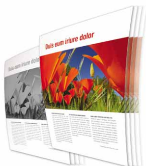
Velocità di stampa di 16/20 ppm